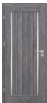
EPIMEDIUM 3 *)