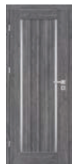
EPIMEDIUM 3 *)