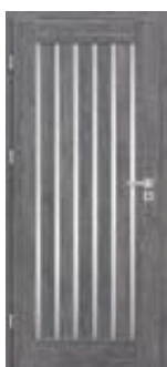
EPIMEDIUM 1 *)