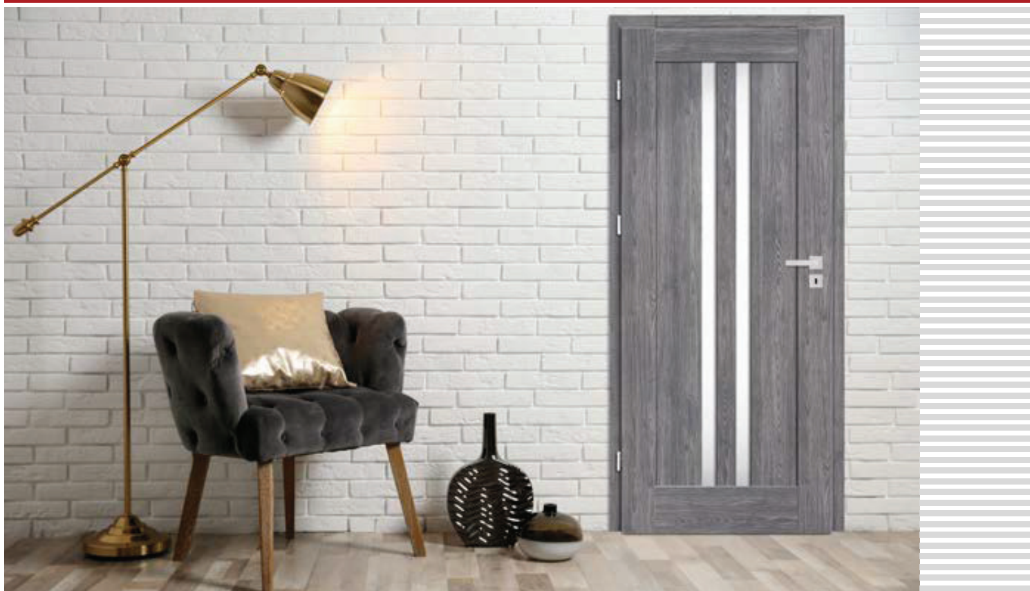
EPIMEDIUM 4, KÓRIS GRAFIT PREMIUM dekorfólia, matt szálciszolt króm CUBE kilincs

BELTÉRI FALCOS VAGY FALC NÉLKÜLI KERETES STILE AJTÓSZÁRNY