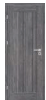
EPIMEDIUM 5 *)