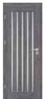
EPIMEDIUM 1 *)