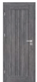
EPIMEDIUM 2 *)