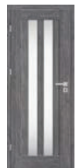
EPIMEDIUM 4 *)