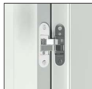
3D pánt (nyitott ajtó)