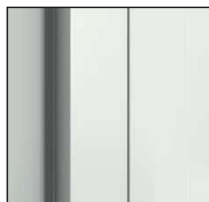
3D pánt (zárt ajtó)