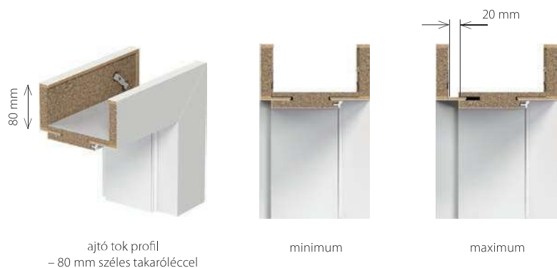
ajtó tok profil – 80 mm széles takaróléccel