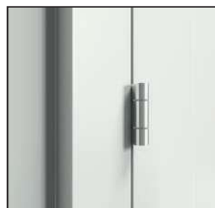
standard pánt (zárt ajtó)*