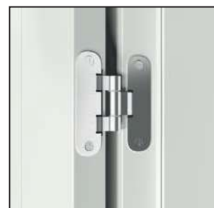
standard pánt (nyitott ajtó)*